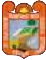
TABLA DE ACTUALIZACION Y CONSERVACION DE LA INFORMACION ARTICULO 92

Los sujetos obligados deberán informar al Instituto y verificar que se publiquen en la Plataforma Nacional de Transparencia, cuáles son los rubros que son aplicables a sus portales de internet, con el objeto de que éstos verifiquen y aprueben, de forma fundada y motivada, la relación de fracciones aplicables a cada sujeto obligado.