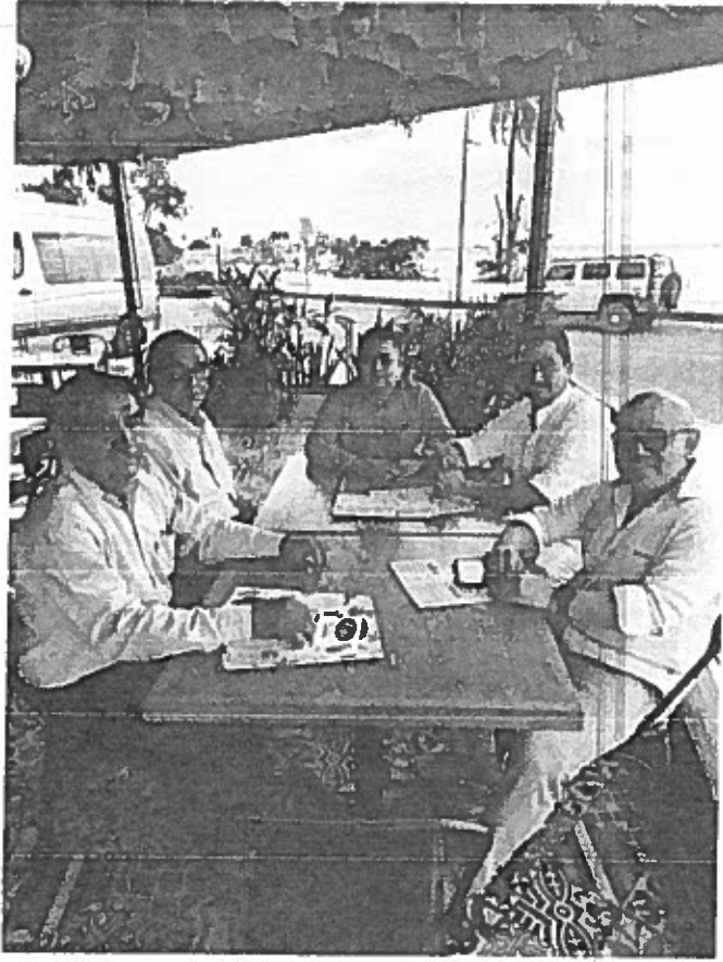
Consumo de alimentos tras una reunión en la ciudad Chetumal Quintana Roo.