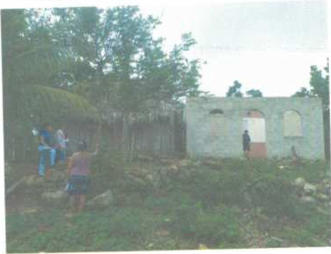
9 Serafin tuyub Poob