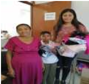
APOYO DE ROPAS ENTREGADAS