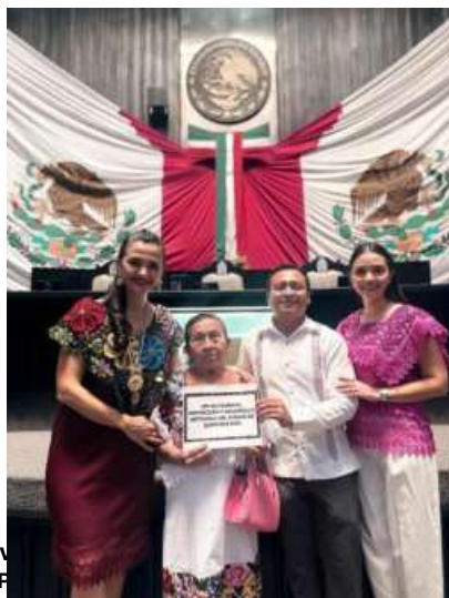
C.C.P. Archiv EDUT / M.A.V.F

Estuvimos acompañados de las dependencias con las cuales mantenemos una coordinación permanente en gestiones como la Secretaría de Desarrollo Económico del Gobierno del Estado de Quintana Roo, SEDETUR - Secretaría de Turismo de Quintana Roo, ICA - Instituto de la Cultura y las Artes y el IESSOL.