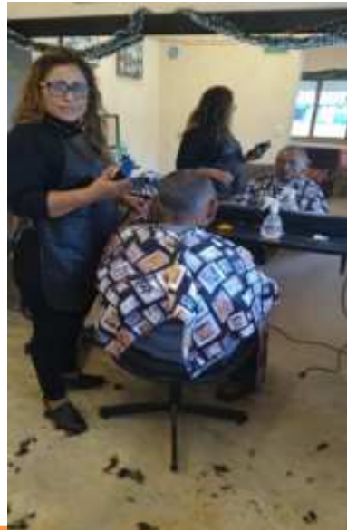
ASISTENCIA SOCIAL REALIZO 58 CORTES DE CABELLOS, EN LA LOCALIDAD DE TEPICH Y F.C.PTO.