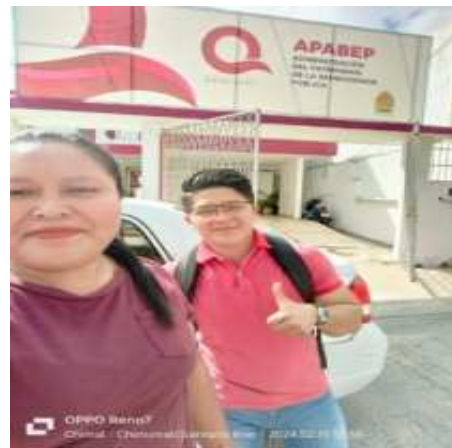
ENTREGA DE DOCUMENTOS PARA PODER GESTIONAR LOS APOYOS DE APARATOS FUNCIONALES EN LA BENEFICENCIA PUBLICA DE CHETUMAL.