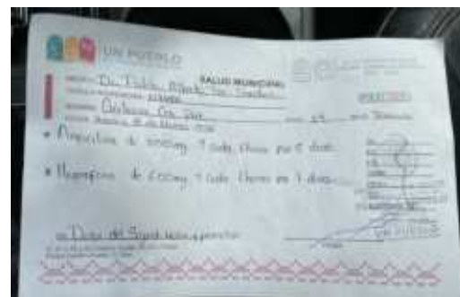
ENTREGA DE APOYOS DE MEDICAMENTOS A LA C. GERBACIA PAT COB, DE LA LOC. DE YAXLEY