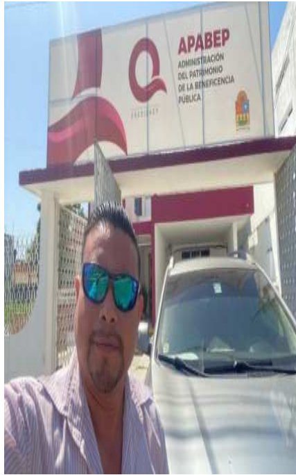
VIAJE A LA CIUDAD DE CHETUMAL EN LA BENEFICENCIA PUBLICA DEL ESTADO. POR LOS POYOS FUNCIONALES.