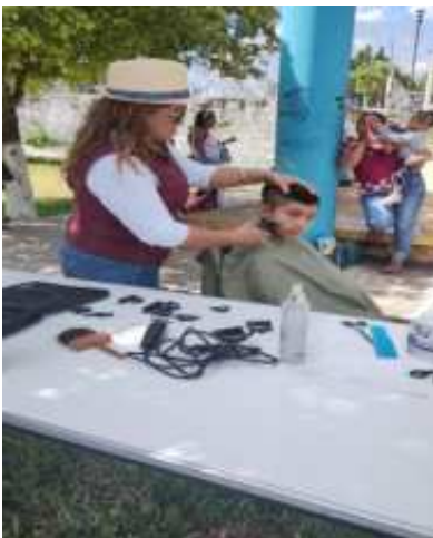
ASISTENCIA SOCIAL REALIZO 50 CORTES DE CABELLOS, EN LA LOCALIDAD DE TEPICH Y F.C.PTO.