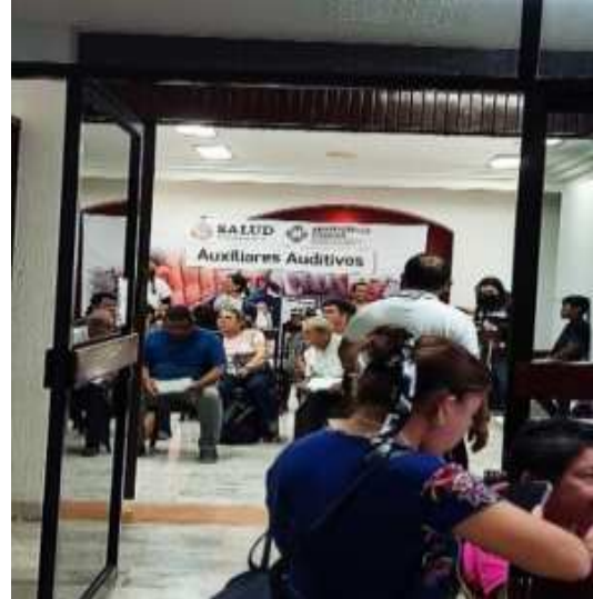
ENTREGA DE 8 AUXILIARES AUDITIVOS EN LA CIUDAD DE CHETUMAL. EL 07-02-24