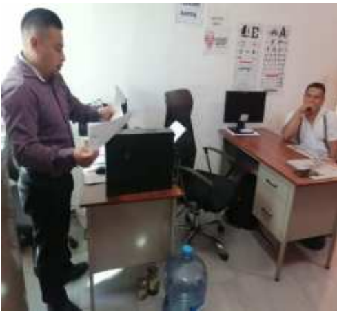
GESTION DE PINTURA PARA LA IGLESIA DE YAXLEY