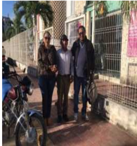
APOYO DE ESTUDIOS DE OFTALMOLOGIA EN OPTICA CRISTAL