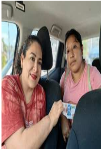
ENTREGA DE 2 APOYO PARA MEDICAMENTOS