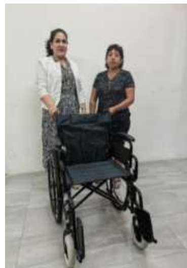
ENTREGA DE APOYOS DE 7 SILLAS ESTANDAR