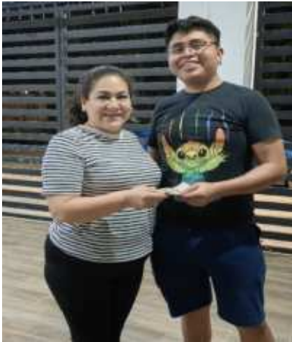
ENTREGA DE 2 APOYOS PARA PASAJE.