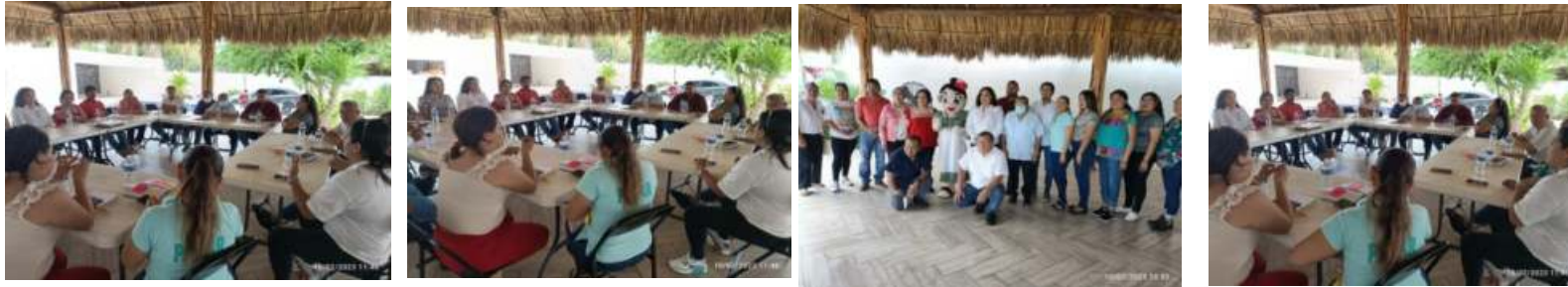
REUNION DE TRABAJO EN LA DIRECCION DEL DIF MPAL EL DIA 13 DE FEB. PARA AGENDAR EL TORNEO DE FUTBOL EN CHUNYAH EL DIA 28 DE FEB