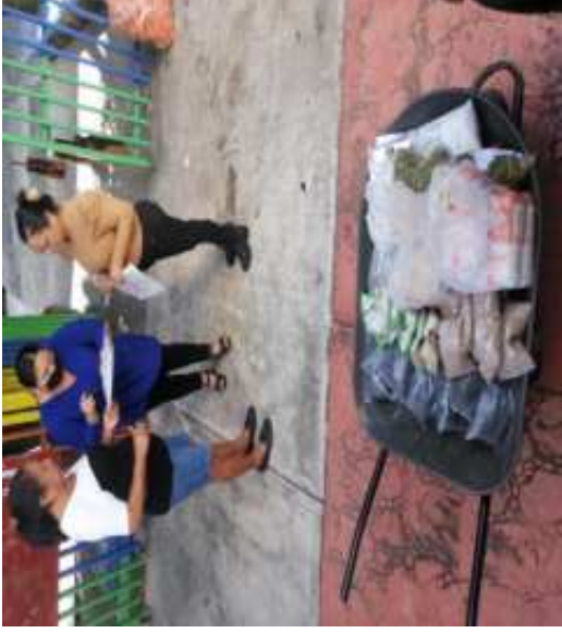
ENTREGA DESPENSA PRIMEROS 1000 DIAS