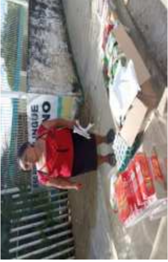
ENTREGA DESPENSA PRIMEROS 1000 DIAS