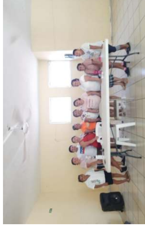
taller de repostería en el comedor mpal.