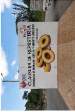
clausura del taller de repostería