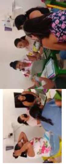
ELABORACION DE PLANES