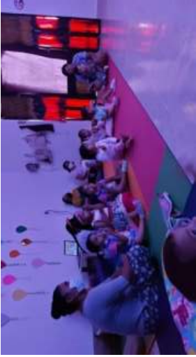
CINE EN PIJAMA