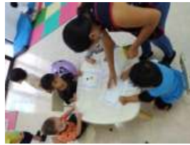
FIESTA DE DISTRACES