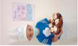
Día de Chef