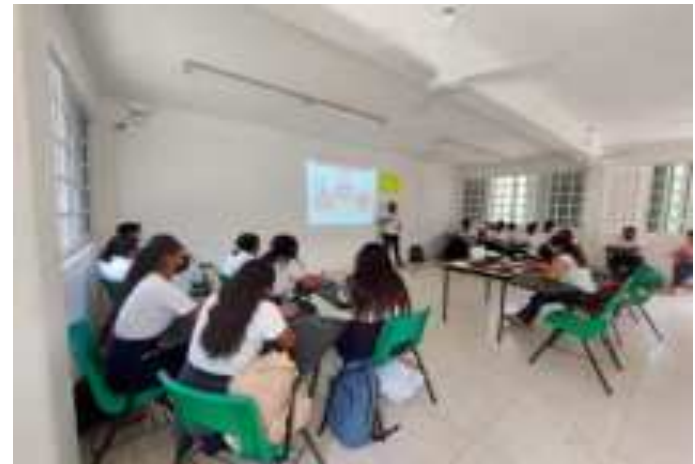
Evidencia del taller denominado " " en la escuela bachilleres de la comunidad de PRESIDENTE JUAREZ 26 /mayo /22