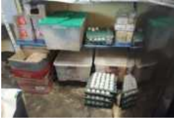
DESPENSA EN DESAMPARO