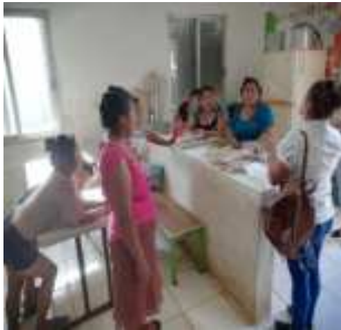
PROGRAMA PILOTO 1000 DIAS