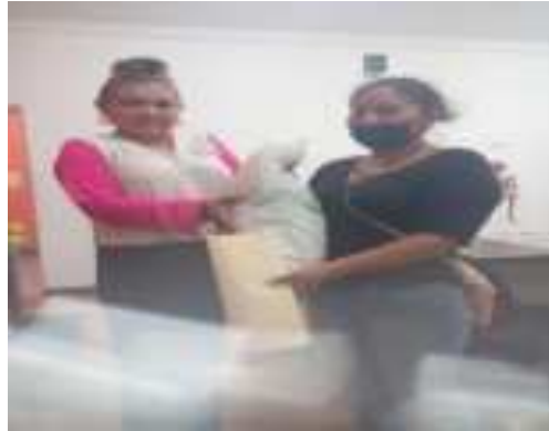
FORMACION DE COMITES DE DESAYUNOS FRIOS Y CALIENTES