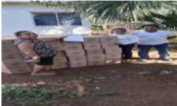
LIMPIEZA DE LAS NUEVAS INSTALACIONES DE LA COORD ALIMENTARIA