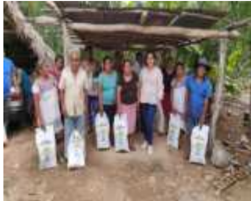
DESPENSA MIL DIAS DE VIDA