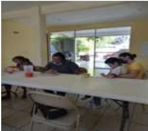
EVIDENCIAS TALLER DE VIOLENCIA DE GENERO FEB-22