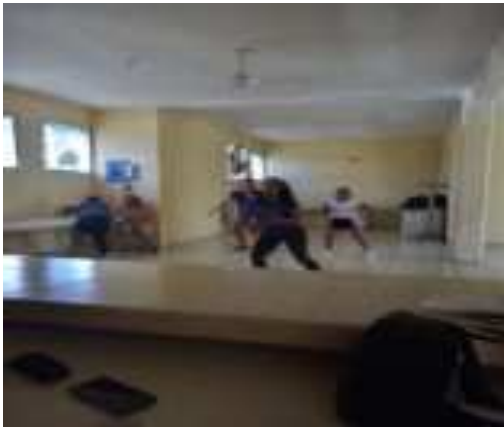
EVIDENCIAS DE "ACTIVACION FISICA MARZO-22