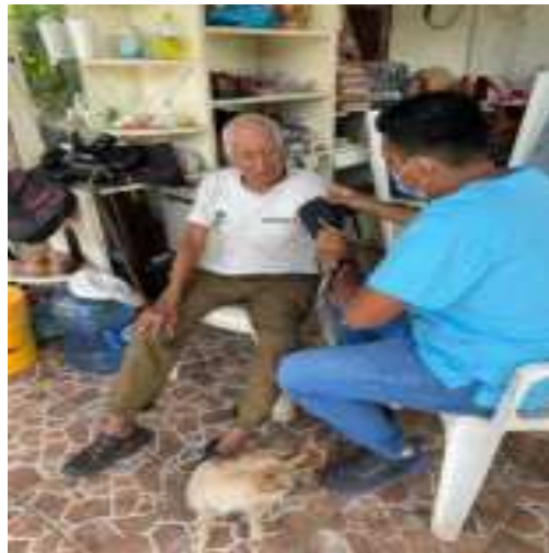
ATENCION MEDICA ( CANALIZACIONES) TOMA DE PRESION