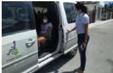
TRASLADO DE MENOR A CENTRO DE REHABILITACION