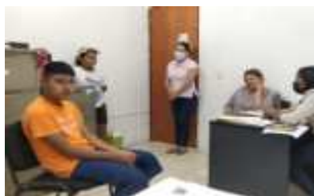
RESOLUCION DE CONFLICTOS FAMILIARES