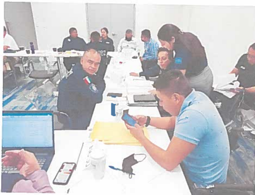
C.C.P. El Archivo