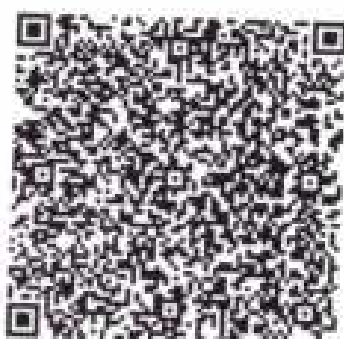
Imagen del comprobante: 2/3

PDF que certifica: 2018090704702 Forma de Autorización: 10/14