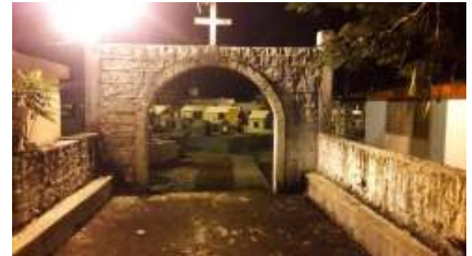
Actividad 5: Rehabilitación de alumbrado para la mejora del espectro de luz.