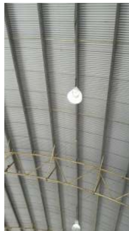
Actividad 7: Rehabilitación de reflectores.