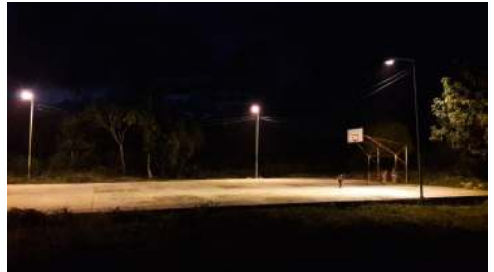
Actividad 8: Rehabilitación de alumbrado.